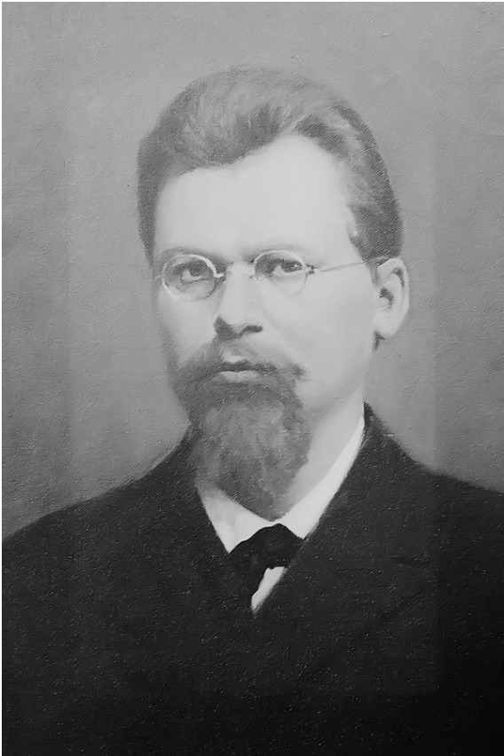
Рис. 1. Портрет Г. Вороного