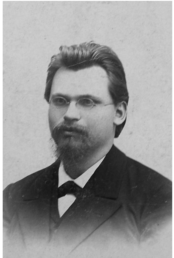
Рис. 2.