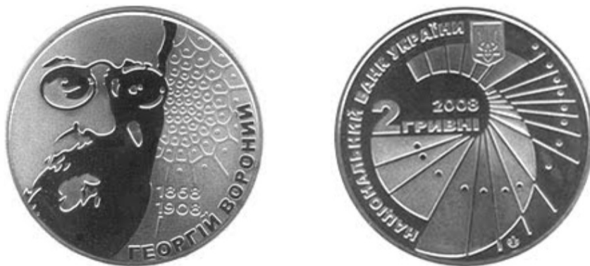
Рис. 3. Монета Г. Вороного