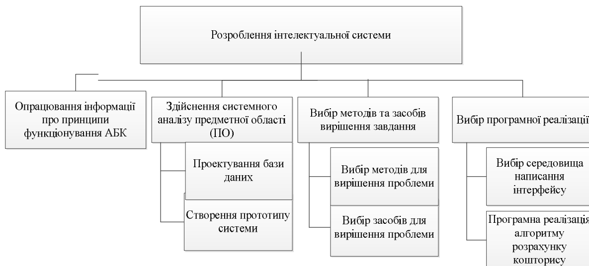
Рис. 1. Дерево цілей інтелектуальної системи

Для розкриття внутрішньої структури мети необхідно побудувати дерево цілей. Дерево цілей забезпечить коректні та поетапні дії під час розроблення інформаційної системи (рис. 1).