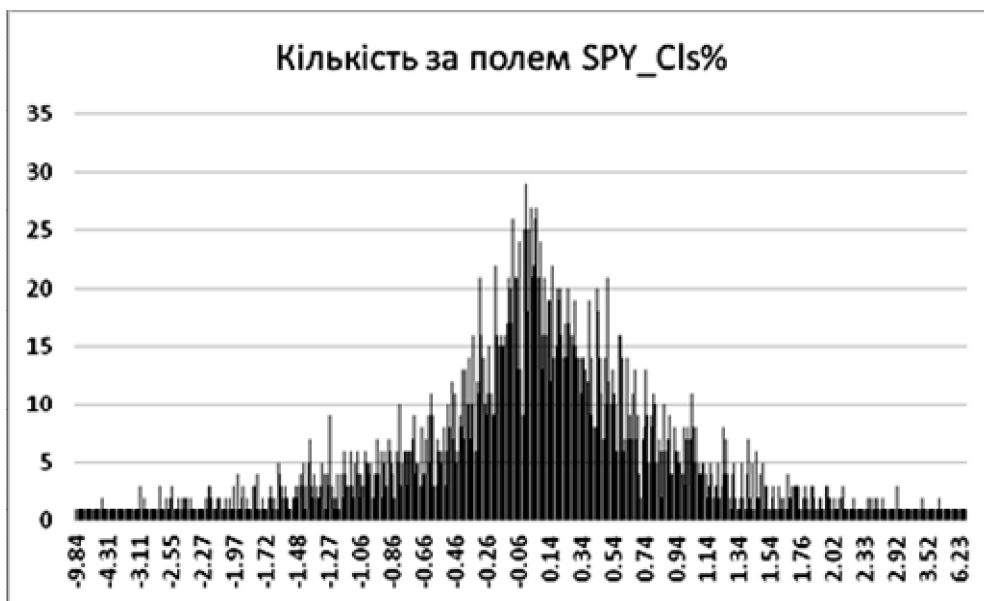
Рис. 2. Процентна зміна ціни закриття за акціями SPY

Майже всі припущення методології VaR передбачають існування нормального розподілу. Для того щоб перевірити тип розподілу цін на акції, побудуємо гістограму розподілу для кожної акції з портфеля (рис. 2). Аналіз свідчить, що вони справді розподілені за нормальним розподілом з близьким до нуля математичним сподіванням. Отже, можна використати таблицю квантилів для нормального розподілу (табл. 3).