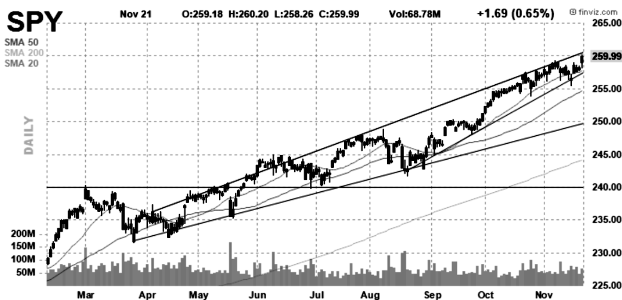
Рис. 1. Тренд S&P500 на ринку США

Попередній кореляційний аналіз портфеля акцій дав змогу відібрати акції, найкорельованіші між собою та із ф'ючерсом на індекс S&P500 (SPY). SPY характеризує динаміку 500 найбільших за капіталізацією компаній США, де на ринку спостерігається висхідний тренд (рис. 1).