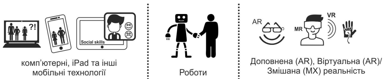
Рис. 2. Інформаційні та комунікаційні технології для покращення соціальних навичок осіб з аутизмом

Отже, технології доповненої та віртуальної реальності є актуальними та перспективними технологіями, використовуваними для покращення соціальних навичок осіб з аутизмом. Ці та інші технології, застосовувані у навчанні таких учнів, подано на рис. 2.