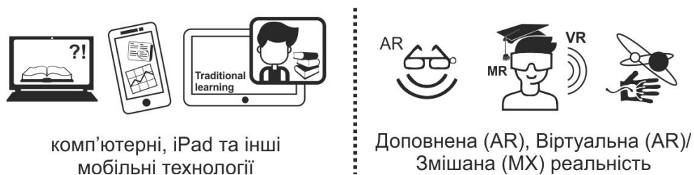
Рис. 3. Інформаційні та комунікаційні технології для супроводу академічного навчання осіб з аутизмом

Португальські дослідники Нельсон Рібейро Хорхе, Ліна Моргадо (Університет Аберта, Португалія) та Педро Дж. С. Гаспар (Інститут політології Лейрія, Португалія) в роботі [70] описали дослідження, спрямоване на перевірку, чи використання технології доповненої реальності, яка підвищує мотивацію студентів-медиків та сприяє розвитку клінічних навичок у прийнятті рішень при діагностиці. Американські дослідники Ned T. Sahin та інші в роботі [71] описали безпечність та відсутність негативних наслідків від тривалого використання технології доповненої реальності для соціальних комунікацій. Позитивні результати були отримані завдяки застосуванню технологій доповненої та віртуальної реальності як терапевтичних інструментів, таким чином допомагаючи людям з аутизмом розпізнавати емоції та покращувати свої соціальні навички, та, відповідно, навчатися. На рис. 3 подано інформаційні та комунікаційні технології для супроводу академічного навчання осіб з аутизмом.