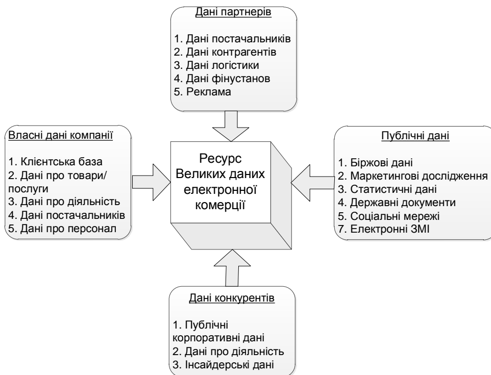
Рис. 2. Структурна модель інформаційного ресурсу Великих Даних систем електронної комерції(рис. автора)

де i=1,2,\dots, N, N – кількість визначених задач T^{BD} , які вирішують із застосуванням Великих Даних; T^i – відповідної тип задачі системи електронної комерції; BD^i(T^i) – релевантний ресурс Великих Даних для вирішення задачі даного типу T^i .