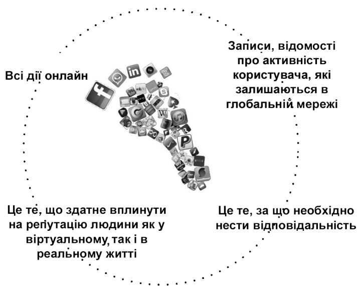
Рис. 2. “Цифровий слід” користувача

2. Анкети, опитувальники . Немає користувача, який би не брав участі у різних опитуваннях чи заповненні анкет. Як правило, введені відповіді структуруються згідно з певним ключем та асоціюються з конкретним користувачем та його інтересами, що також приводить до створення цифрового сліду та підлаштування параметрів голосового пошуку.