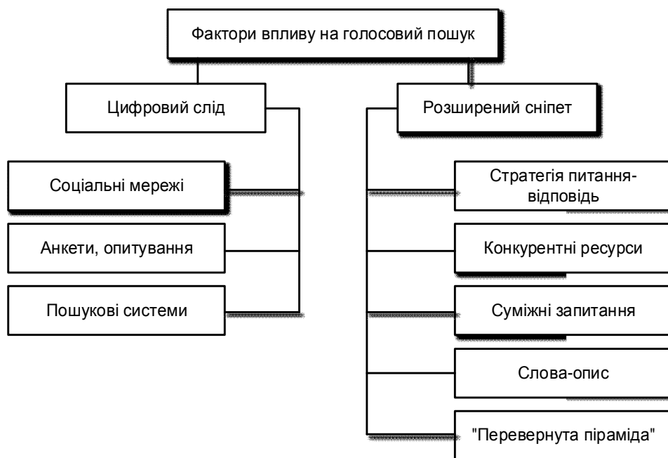
Рис. 1. Фактори впливу на голосовий пошук

Оптимізація та просування інтернет-ресурсів є одним з найбільш динамічних напрямків ІТ-галузі. Одна із останніх змін пов’язана з ростом популярності голосового пошуку. Якщо донедавна голосовий пошук був чимось винятковим, то сьогодні він перетворився на необхідність, що пов’язано насамперед із розвитком технологій мобільного інтернету та розумних пристроїв [6,7]. Сьогодні значно простіше сформувані голосовий запит до мобільного пристрою, ніж набирати відповідний текст на віртуальній клавіатурі. Такий стан речей потребує застосування нових підходів до просування інтернет-ресурсів з метою їх оптимізації під особливий тип пошуку – голосовий. Оскільки пошукові механізми, які впроваджують технології голосового пошуку, використовують методи машинного навчання та штучного інтелекту, то для аналізу всієї інформації за ресурсом важливим завданням є дослідження всіх чинників, які безпосередньо впливають на пошукову видачу. Проведене дослідження залежності пошукових видач від голосових запитів показало, що необхідною умовою включення сторінки в результати пошуку є дотримання множини оптимізаційних чинників, які застосовують у процесі ранжування [12], та факторів, що безпосередньо впливають на голосове просування.