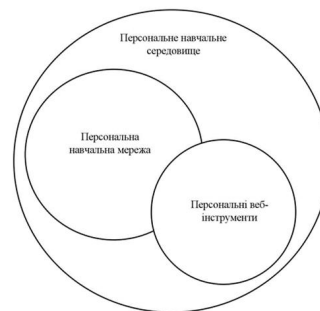
Рис. 1. Узагальнена схема персонального навчального середовища

До мінімального набору інструментарію PLE, на думку західних експертів, повинні входити [9]: blog, ePortfolio, microblog, twitter та інші веб-інструменти (рис. 2).