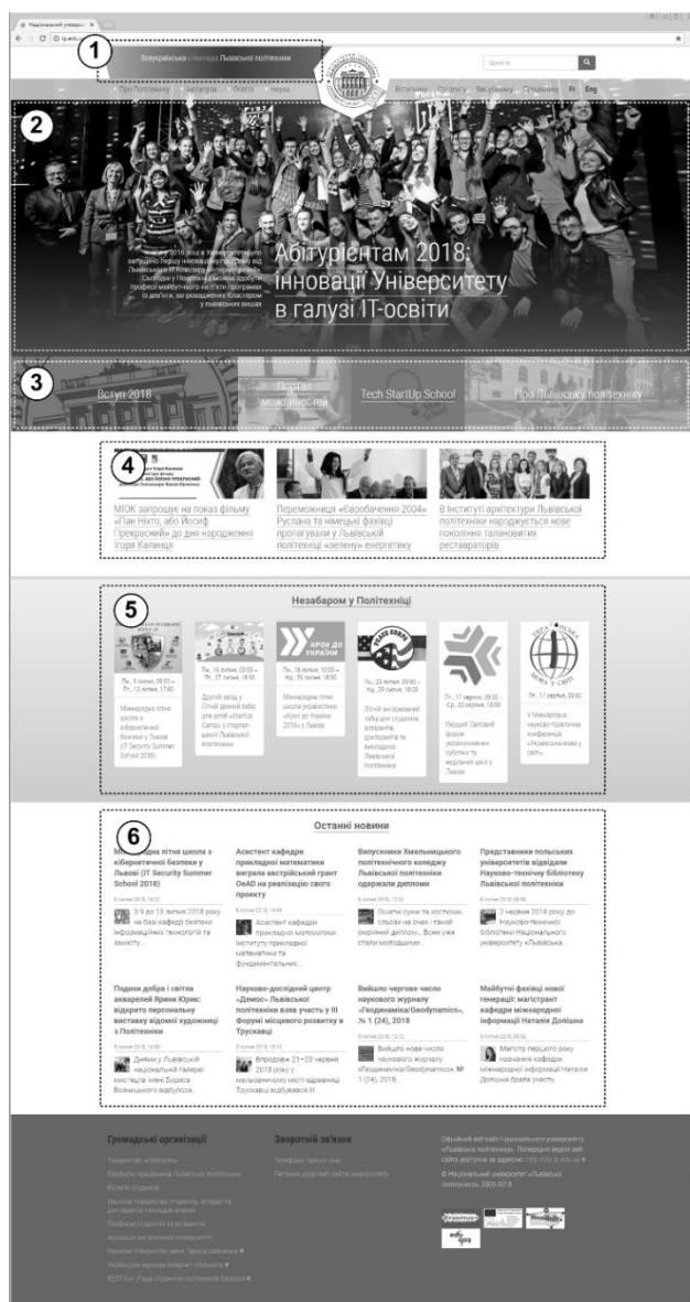
Рис. 3. Блоки інформаційного наповнення на головній сторінці