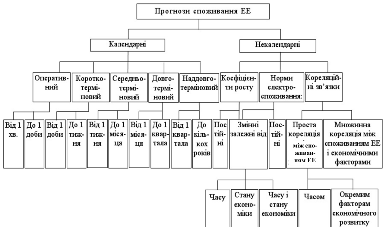
Рис. 3. Узагальнена класифікація прогнозів споживання ЕЕ

Програма ІАС “Прогноз” може виконуватись на персональному комп’ютері з процесором, не нижчим Pentium II або сумісному в операційному середовищі Windows. Для нормального функціонування програми необхідно не менше 128 МВ оперативної пам’яті і не менше 100 МВ вільного дискового простору. Для інсталяції програми необхідно 1.5 МВ вільного місця на жорсткому диску. На рис. 2 наведено три основні вікна ІАС “Прогноз”.