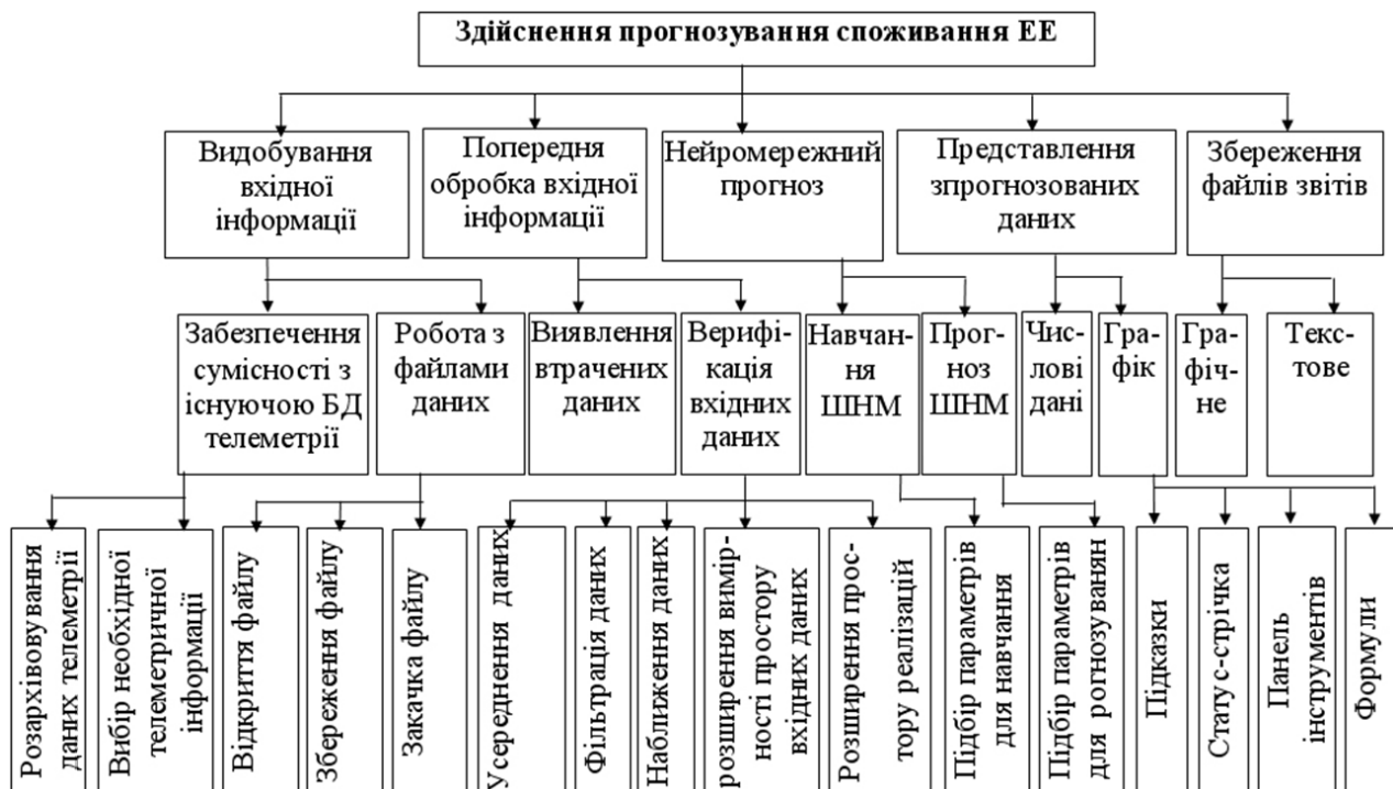
Рис. 1. Дерево цілей ІАС “Прогноз”

У розробленій ІАС “Прогноз” [2] здійснено спробу використати переваги інформаційних і аналітичних задач. Ця система є автоматизованою, оскільки керівні рішення здійснює диспетчер, а програма є лише дорадчою. Тому її можна вважати окремим типом інформаційно-аналітичних задач оперативного керування. Основною перевагою ІАС “Прогноз” є можливість її функціонування в “on-line” або “on-demand” режимі, що є суттєвим для розв’язання задач оперативного керування режимами енергосистеми. Задачі оперативного прогнозування є найактуальнішими в галузі електроенергетики, оскільки більшість процесів є практично миттєвими (наприклад, коротке замикання, падіння частоти в електромережі тощо).