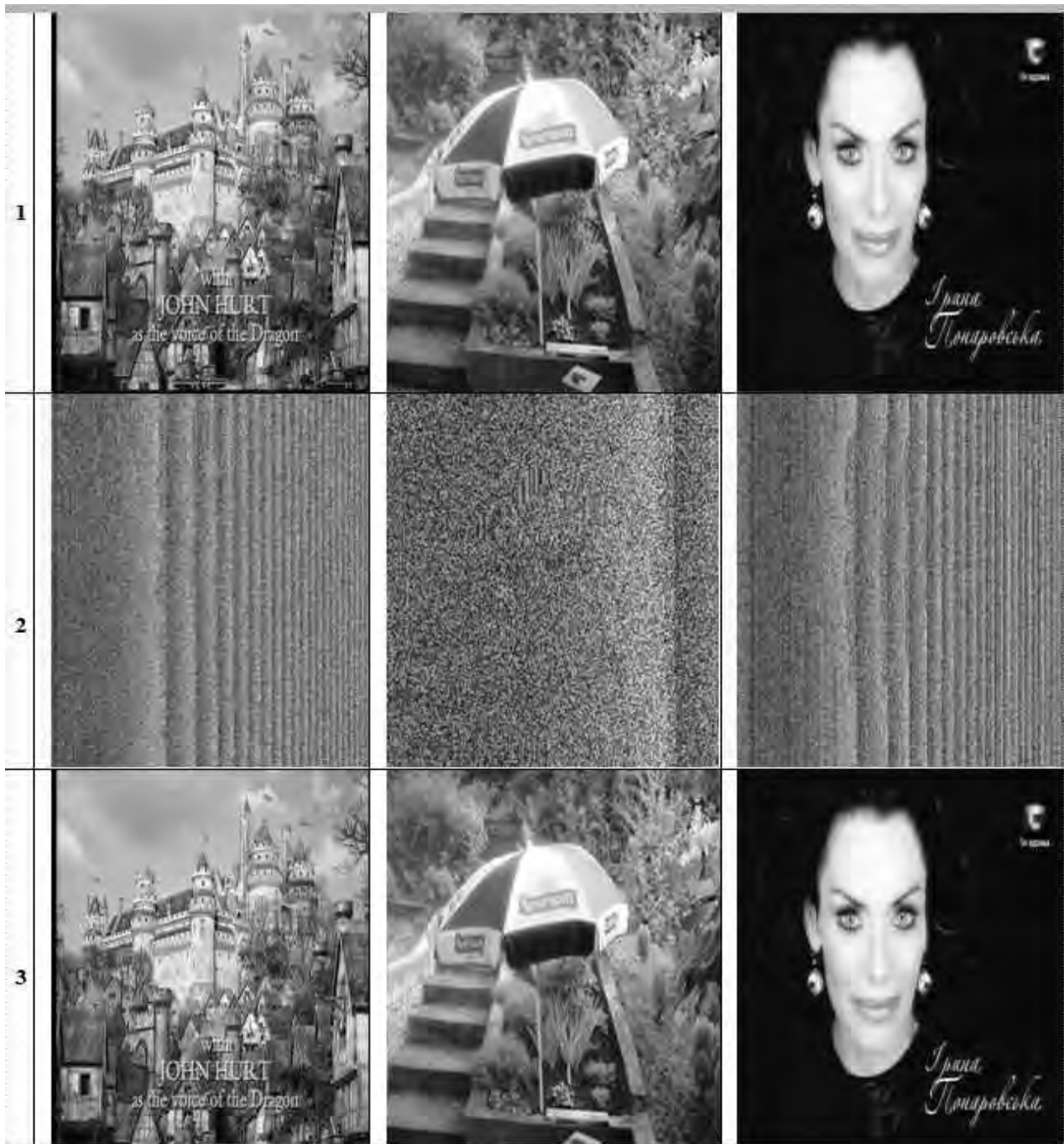
Рис. 1. Зображення: 1 – початкові; 2 – зашифровані; 3 – дешифровані