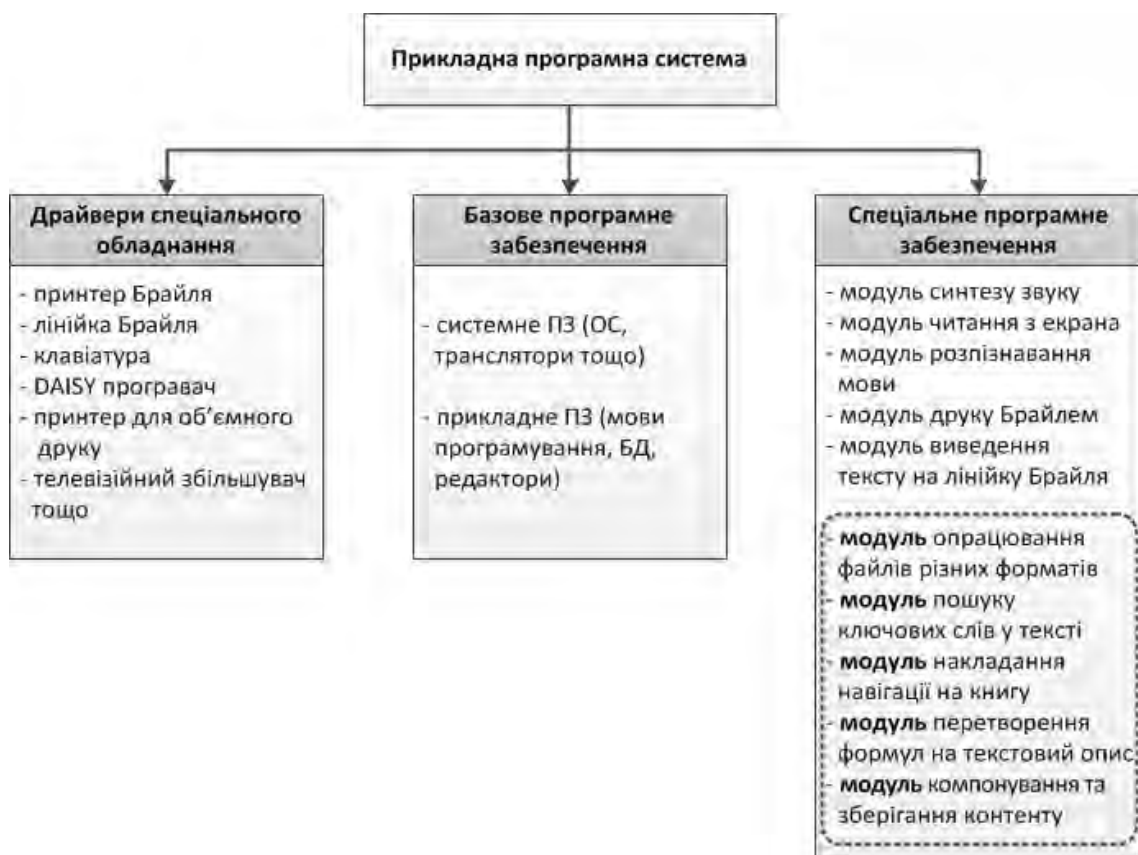
Рис. 1. Структурна схема прикладної системи опрацювання україномовних технічних текстів для людей з вадами зору