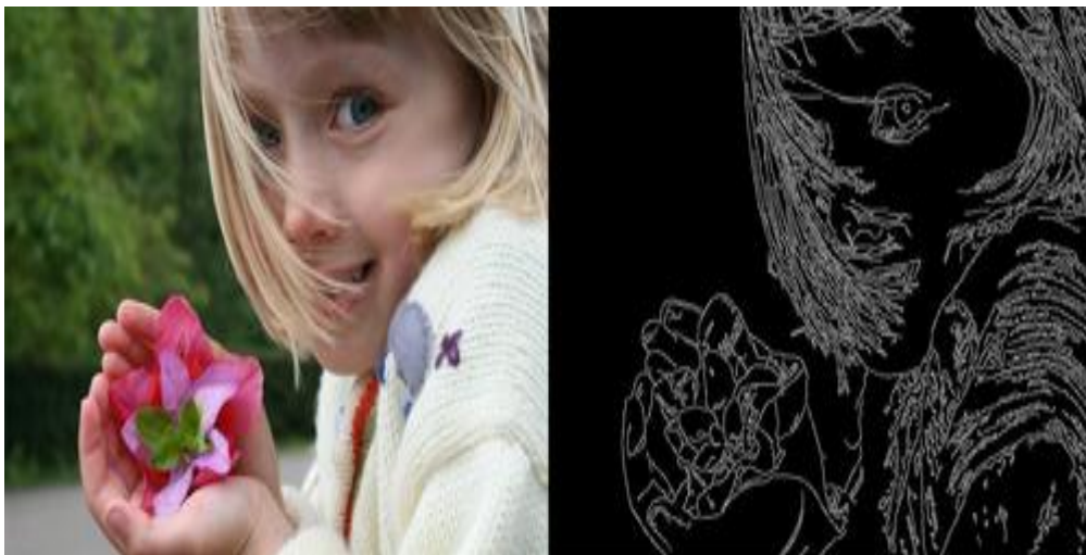
Рис. 1. Зображення і контури в зображенні

Наявність у зображенні контурів є його важливою характеристикою. Задача виокремлення контура передбачає застосування операцій над сусідніми елементами зображення, які є чутливими до змін і пригашають області постійних рівнів яскравості, тобто, контури – це області, які є світлими, тоді як інші частини зображення залишаються темними [3].