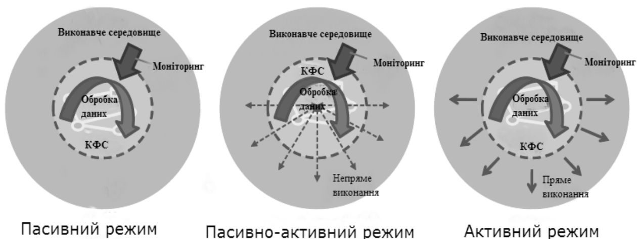
Рис. 2. Режими роботи КФС

Будь-яка кіберфізична система може перебувати в одному з трьох можливих режимів: пасивний, пасивно-активний та активний (рис. 2).