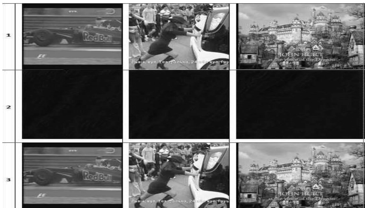
Рис. 1. Результати шифрування- дешифрування зображення: 1 – початкові зображення; 2 – зашифровані зображення; 3 – дешифровані зображення

Дешифрування проводять у послідовності, протилежній до шифрування після отримання числа B^d \equiv (A^e)^d \pmod{N} , виконанням протилежних операцій до змісту пунктів (3), (2), (1). Результати наведено на рис.1.