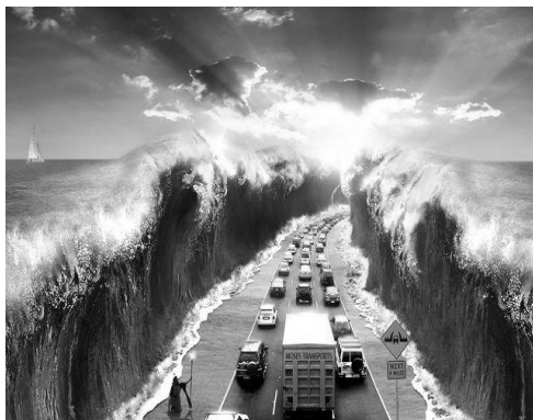
Рис. 3. Вхідне зображення