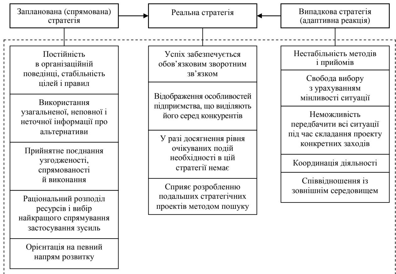
Рис. 1 Характерні риси стратегії підприємства