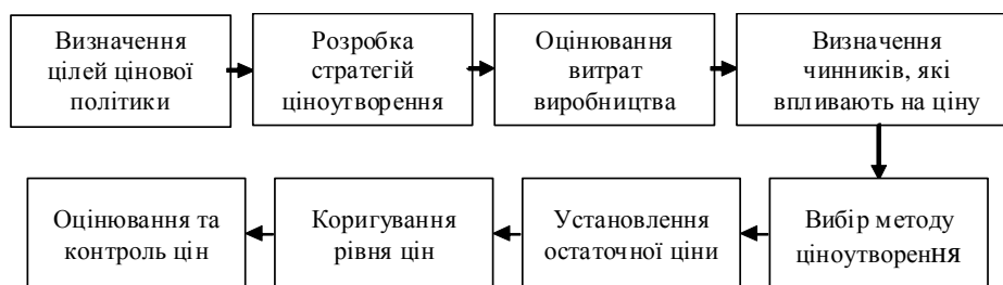
Рис. 1. Модель процесу ціноутворення [3, с. 186]

Дослідники В. Г. Герасимчук і А. Е. Розенплентер запропонували таку модель процесу ціноутворення (рис. 1).