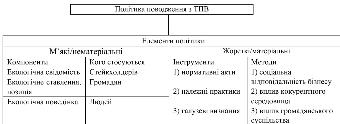
Рис. 2. Концепція створення цивілізованої політики поводження з ТПВ

Представлена модель фаз життєвого циклу відходів (рис. 1) дає змогу визначити загальні засади створення цивілізованої політики поводження з ТПВ (рис. 2).