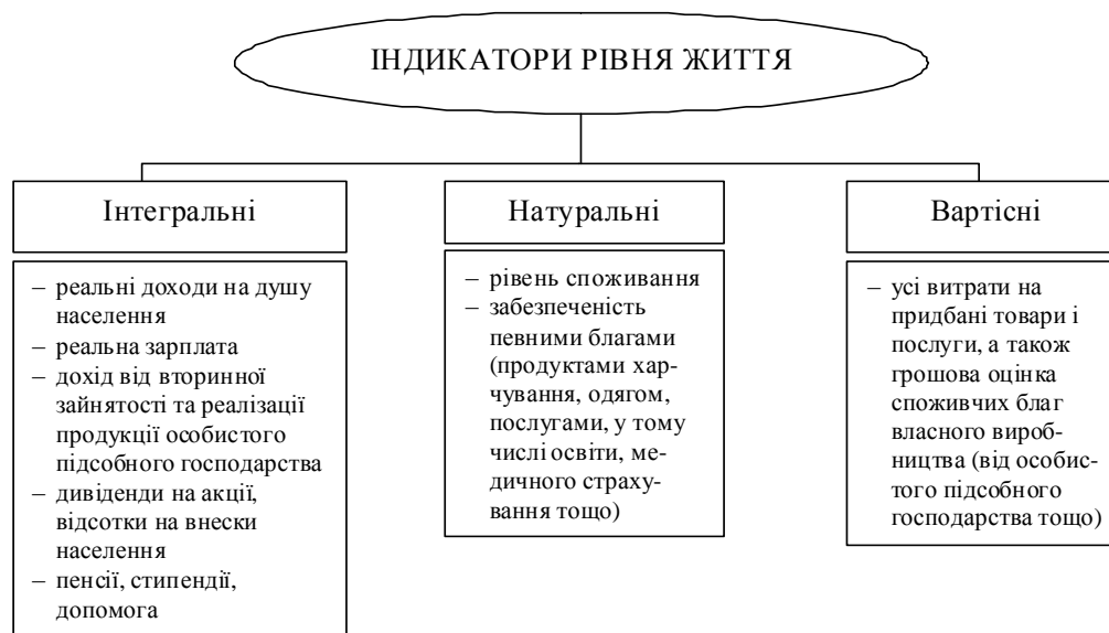
Рис. 2. Індикатори рівня життя [5, с. 17]

Для виміру рівня життя використовують інтегральні, натуральні та вартісні індикатори.