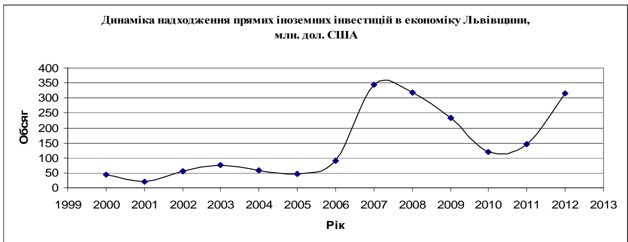
Рис. 3. Іноземні інвестиційні надходження в економіку Львівщини за період 2000–2012 рр.

Як бачимо з даних рис. 3, основний пік залучення інвестицій іноземними інвесторами у Львівську область припадає на 2007 рік і відтоді до 2010 року він спадає. Однак з 2011 року знову спостерігається початок їх зростання, визначальною першопричиною якого виступав проведений в Україні чемпіонат “Євро-2012”.