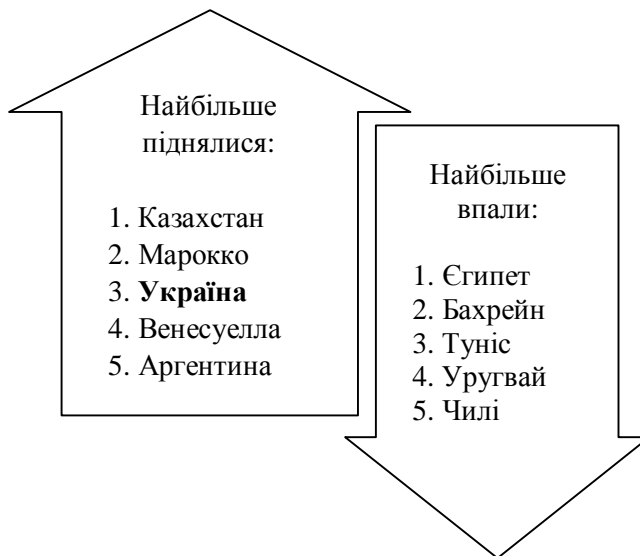
Рис. 1. Динаміка найбільших змін в EMLI 2013