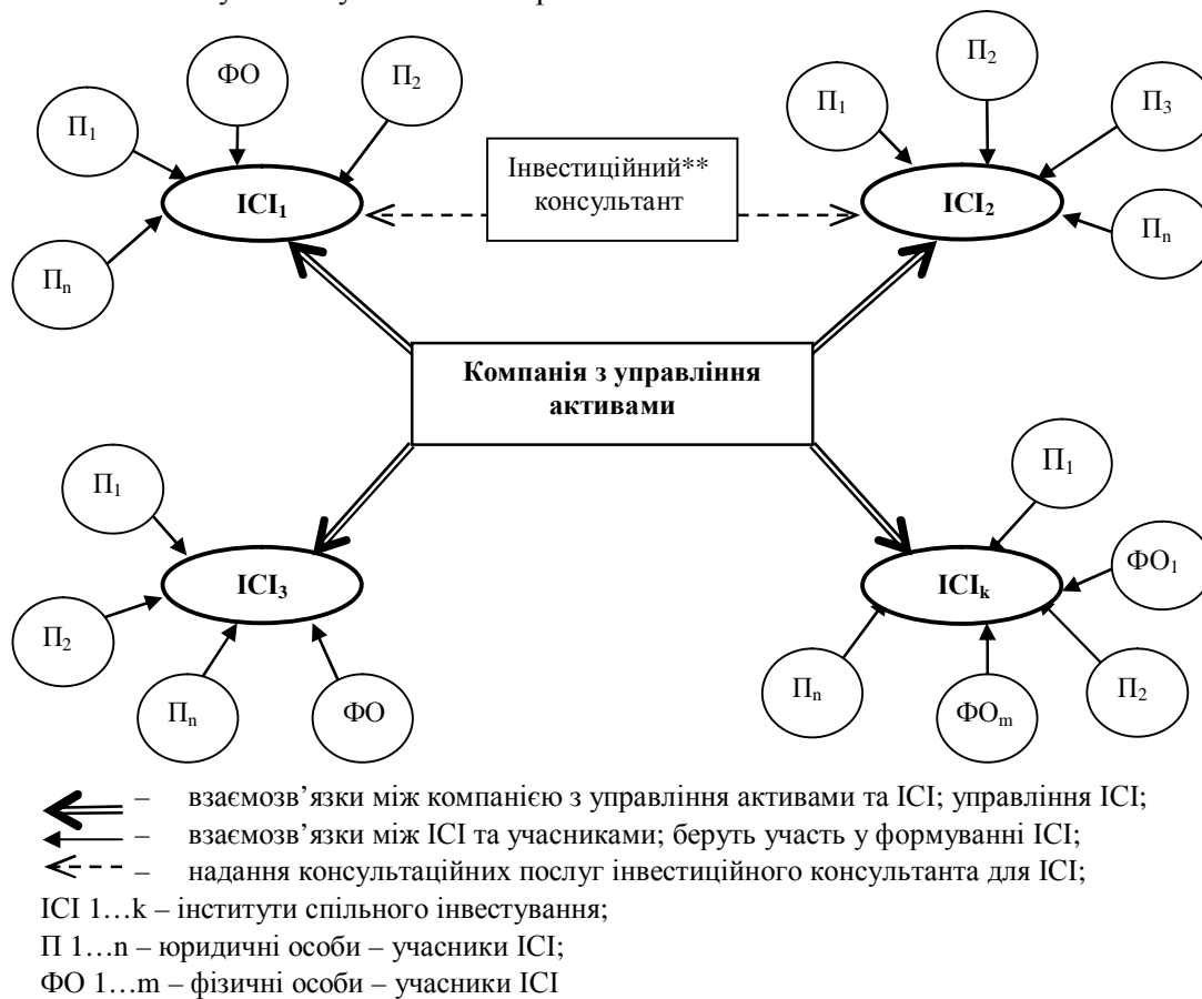
Рис. 2. Система взаємозв'язків суб'єктів, які формують та управляють ІСІ*: *Джерело: складено автором на основі аналізу літературних джерел [6; 10–15]

В результаті взаємної роботи ІСІ, керуючого ним підприємства – компанії з управління активами, формуючими ІСІ учасниками, а саме – юридичними та фізичними особами, та інвестиційними консультантами утворюється система взаємозв'язків суб'єктів, які формують та управляють ІСІ. Таку систему показано на рис. 2.