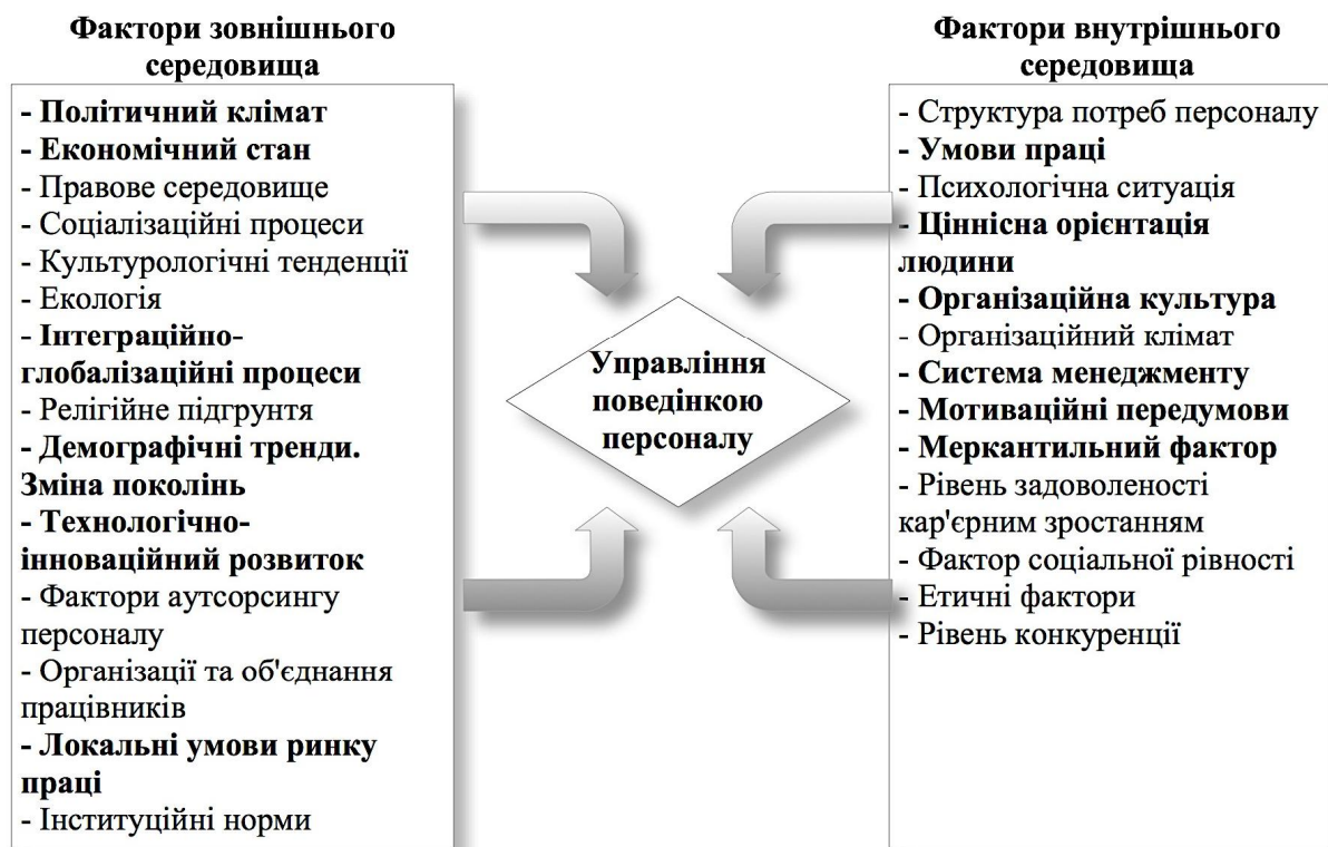
Рис. 2. Фактори зовнішнього та внутрішнього середовища, які впливають на управління поведінкою персоналу

Для глибокого розуміння тонкощів впливу факторів на управління поведінкою персоналу, слід проаналізувати важливість впливу зовнішнього та внутрішнього середовищ. Зовнішнє середовище має чи не найбільший вплив на формування поведінки персоналу, адже охоплює низку факторів впливу. Під час функціонування підприємство стикається з різними ситуаційними чинниками, силами та інституціями, які, своєю чергою, мають вагомий вплив на життєдіяльність підприємства, адже кожен суб'єкт господарювання є активним учасником ринку. Щодо внутрішнього середовища, то це безпосередні чинники та стимулятори всередині підприємства. Вони характеризуються певною мірою суб'єктивністю впливу [2]. Зовнішнє середовище характерне своєю динамічністю та непередбачуваністю. Це, своєю чергою, призводить до низки труднощів, адже динамічність та непередбачуваність не дозволяє повною мірою контролювати процесом та аналізувати сценарії в довгостроковій перспективі. Отже, на рис. 2 систематизуємо фактори зовнішнього та внутрішнього середовища, які впливають на управління поведінкою персоналу.