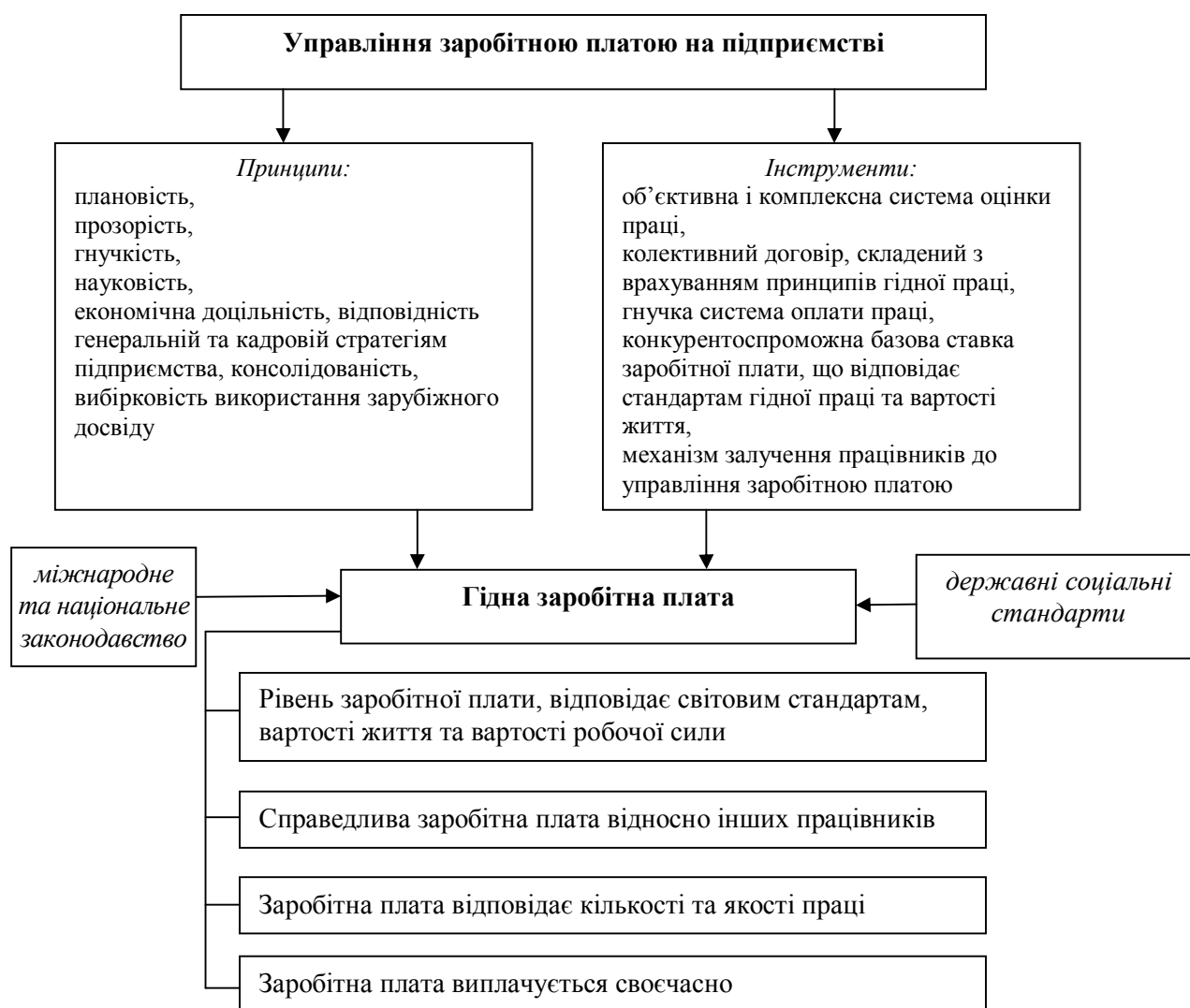
Рис. 3. Логіко-структурна схема формування гідного рівня оплати праці на підприємстві

органи та уряд) мають брати активну участь щодо забезпечення гідної оплати праці та виказувати спільну зацікавленість у розробленні сучасних інструментів управління оплатою праці.