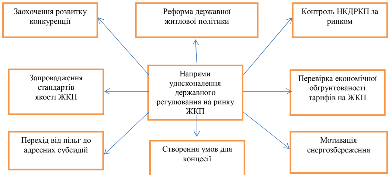
Рис.2. Основні напрями удосконалення державного регулювання на ринку житлово-комунальних послуг

Заохочення розвитку конкуренції може бути забезпечене у діяльності лише тих суб'єктів господарювання, які не є природними монополістами на ринку ЖКП (централізоване опалення, гаряче та холодне водопостачання та водовідведення). При цьому проблема створення ефективного конкурентного середовища є найактуальнішою у діяльності підприємств з обслуговування житла, оскільки у нашій державі поки що не створено інституту управляючих будинками, на яких покладалися би обов'язки щодо вибору надавача послуг та розірвання договорів, якщо мешканців відповідних будинків не задовольнятиме якість ЖКП.