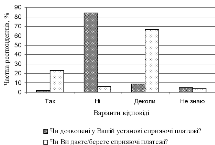
Рис. 2. Результати експрес-опитування на предмет використання фасилітаційних платежів