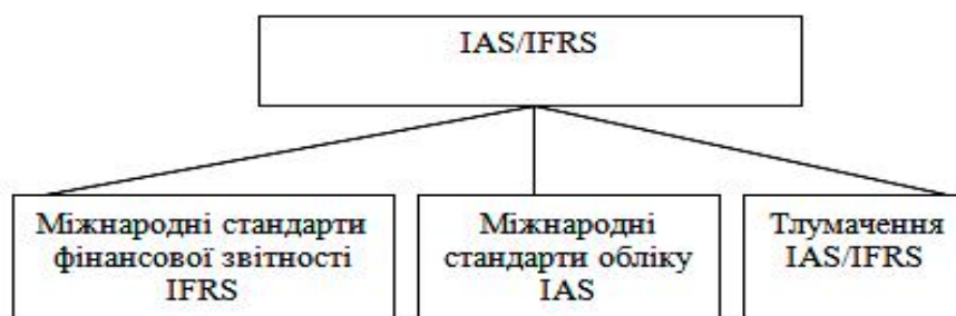
Рис. 2. Структура IAS/IFRS