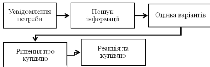
Рис. 1. Етапи прийняття рішення про купівлю

Етап 1. Процес ухвалення рішення про покупку розпочинається з усвідомлення покупцем потреби. Тут діють дві групи подразників – внутрішні й зовнішні. На цьому етапі виділяють, які саме проблеми виникли, чим викликана їх поява і як саме вони вивели споживача на визначений товар.