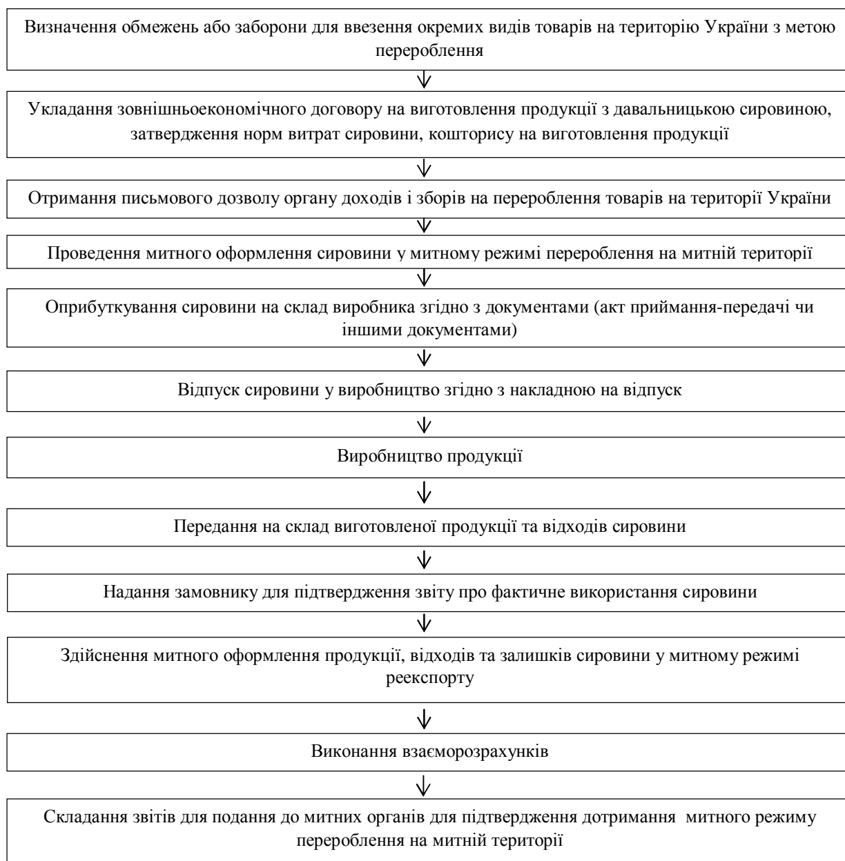
Рис. 1. Алгоритм імплементації толінгових операцій

Як і будь-яка діяльність, толінгові операції є процесом, що складається з певних етапів. Алгоритм імплементації толінгових операцій зображено на рис. 1 [13].