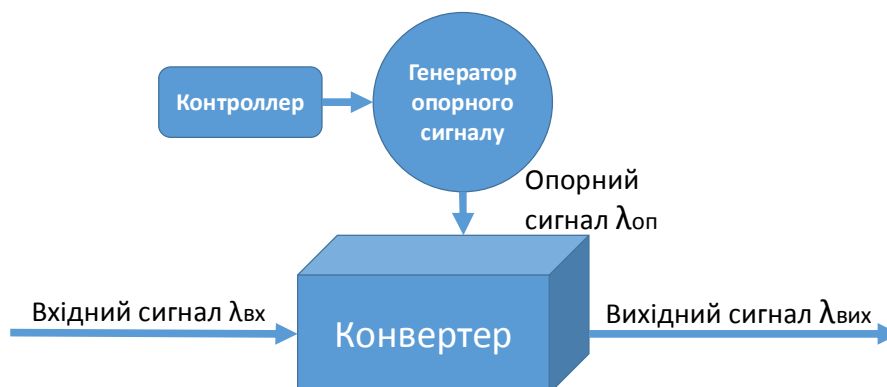
Рис. 3. Модель пристрою узгодження довжин хвиль

Пристрої узгодження довжин хвиль на основі нелінійного ефекту чотирьохвильового змішування [10] в оптичному волокні використовують явище, за якого три хвилі з частотами f_1 , f_2 , f_3 приводять до генерації четвертої хвилі f = f_1 + f_2 - f_3 або f = 2f_1 - f_3 при f_1 = f_2 . Модель пристрою для узгодження довжин хвиль наведена на рис. 3.