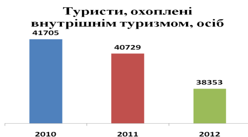
Рис. 1. Динаміка відвідання Львівщини вітчизняними та іноземними туристами [16]

Показники діяльності туристичних підприємств Львівщини свідчать про те, що туризм та відпочинок набувають все більшого значення для соціально-економічного розвитку області і характеризуються позитивною динамікою за попередні три роки (рис. 1) [16].