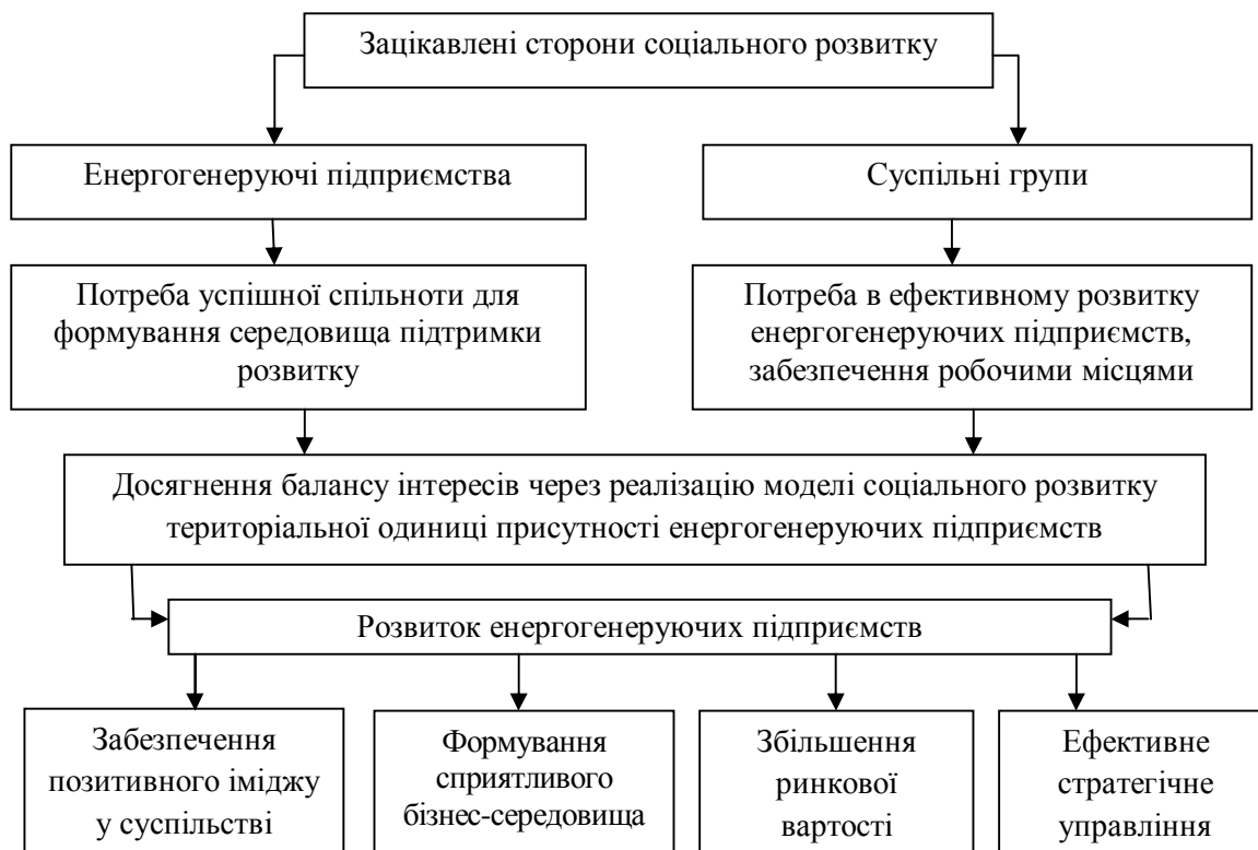
Рис. 2. Результативність запропонованих заходів соціального розвитку територіальних одиниць присутності енергогенеруючих підприємств

Участь енергогенеруючих підприємств у соціальному розвитку територіальних одиниць присутності відкриває для них інші важливі переваги (рис. 2).