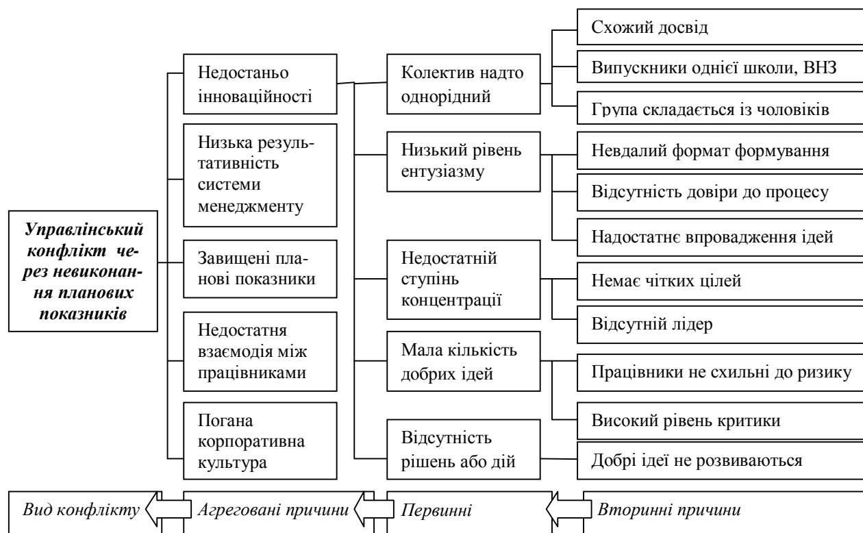
Рис. 2. Структура причин виникнення управлінських конфліктів в організації

Регулювальна функція полягає у тому, що в процесі конфлікту менеджмент організації або державні органи влади змушені розробляти методи та засоби для регулювання існуючих конфліктних ситуацій (норми, інститути, організації) та недопущення виникнення дисфункціональних конфліктів та наслідків.