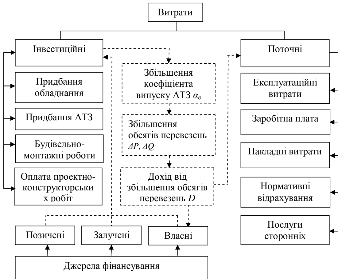
Рис. 3. Структура витрат, пов'язаних із модернізацією ВТБ АТП, у системному зв'язку з джерелами фінансування

Витрати, пов'язані із модернізацією ВТБ АТП, складаються з інвестиційних (початкових) і поточних витрат. Останні забезпечують належне функціонування підприємства і експлуатаційні витрати при збільшенні обсягів перевезень. Структуру витрат у системному зв'язку із джерелами фінансування наведено на рис. 3.