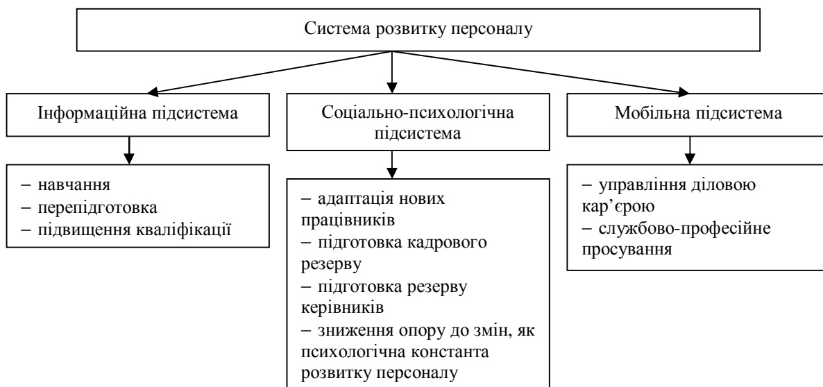
Рис. 2. Підсистеми розвитку персоналу

Технічна система – ефективне поєднання технічних засобів. Технологічна система основана на поділі діяльності організації на стадії і процеси. Організаційна система із розробленням структури управління, відповідних положень і інструкцій дає змогу раціонально використовувати технічні засоби, предмети праці, інформацію, площі і трудові ресурси. Економічна система – це єдність господарських і фінансових процесів та зв'язків, а соціальна – це сукупність соціальних відносин, які утворюються в результаті спільної діяльності людей і соціальних груп.