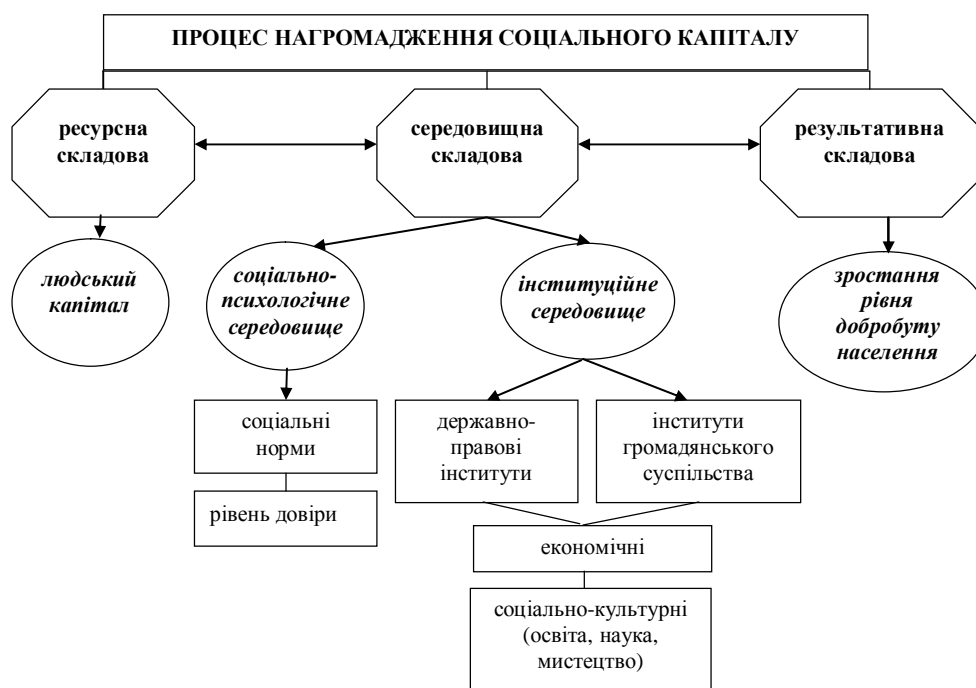
Рис. 1. Складові процесу нагромадження соціального капіталу економічної системи

Процес нагромадження соціального капіталу економічної системи може бути представленим єдністю трьох його складових: 1) ресурсна складова (людський капітал); 2) середовищна складова (соціально-психологічне та інституційне середовища); 3) результативна складова (рівень добробуту населення) (рис. 1).