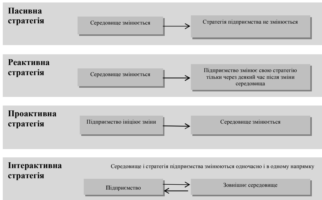
Рис. 1. Основні стратегії реагування підприємства на зміни у зовнішньому середовищі

Закордонні дослідження показують, що пасивна, реактивна і проактивна стратегії можуть принести тимчасовий, короткотерміновий успіх у діяльності підприємства. Довготерміновий успіх підприємству забезпечує тільки використання інтерактивної стратегії [5].