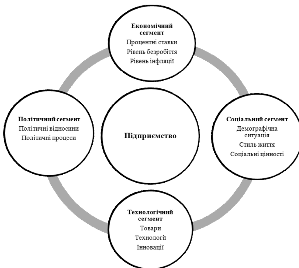
Рис. 2. Макросередовище бізнесу

Аналіз тенденцій полягає в прогнозуванні впливу поточних процесів на майбутнє. Підприємства, які виробляють продукцію довготермінового призначення, повинні враховувати довготермінові тенденції в макросередовищі бізнесу. Аналіз подій передбачає оцінку специфічних процесів, які мають або можуть впливати на діяльність підприємства. Так, наприклад, підприємства стежать за всіма пропозиціями, що стосуються змін у системі оподаткування. Цей аналіз враховується під час лобювання своїх позицій в уряді і парламенті. Оскільки навколо підприємств відбувається безліч подій одночасно, вони змушені вибирати пріоритетні. На рис. 3 зображено матрицю суспільних подій [5]. Вперше її використовувала американська компанія General Electric.