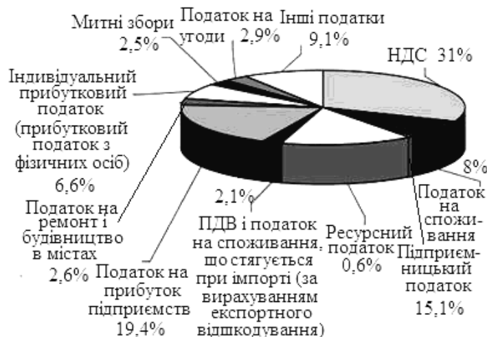
Рис. 2. Структура податкових доходів КНР (за підсумками 2009 р.) [6]

Китай. Побудована дієва податкова система, адаптована до “ринкової економіки соціалізму”. Чинна податкова система КНР спрямована на відкриття Китаю зовнішньому світу, що сприяє розвитку національної економіки. Головні принципи оподаткування: справедливість при оподаткуванні, чіткість і простота під час обчислення та стягнення податків (рис. 2).