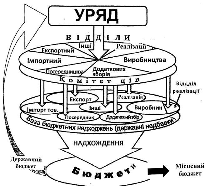
Рис. 4. Схема структури Комітету цін та його сфери впливу

Обов'язковою умовою впровадження НЕС є збільшення заробітної плати працівників. За рахунок чого? При реалізації проекту ціна товару і послуг (її собівартість) зменшиться на величину податків (податковий блок витрат), який, за різними даними, становить від 20 до 60 % вартості продукції. Ціни на продукцію переважно залишаться незмінними. Колишню величину податкового блоку в собівартості продукції буде розподілено на дві частини, а саме: підвищення зарплатні працівників і збільшення обігових коштів підприємств, що стимулюватиме їхній розвиток.