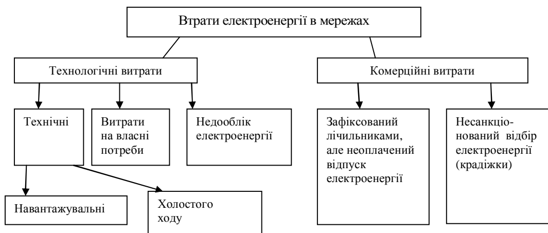
Рис. 1. Структура втрат електроенергії в розподільних мережах

Структура втрат електроенергії в мережах матиме такий вигляд (рис. 1).