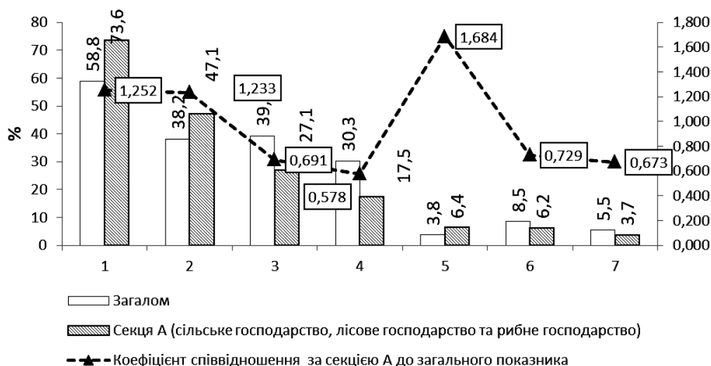
Рис. 2. Складові фонду оплати праці суб'єктів економічної діяльності за секцією А та загалом за усіма видами економічної діяльності України у 2016 р.: 1 – основна заробітна плата у фонді оплати праці; 2 – надбавки і доплати до тарифних ставок та посадових окладів в основній заробітній платі; 3 – премії та винагороди, що мають систематичний характер в основній заробітній платі; 4 – заохочувальні та компенсаційні виплати у фонді оплати праці; 5 – матеріальна допомога у заохочувальних та компенсаційних виплатах; 6 – соціальні пільги індивідуального характеру у заохочувальних та компенсаційних виплатах; 7 – нарахування за невідпрацьований час у фонді оплати праці Побудовано за [16].

По-восьме, дослідивши структуру фонду оплати праці працівників суб'єктів господарювання за секцією А КВЕДу-10 – сільське господарство, лісове господарство та рибне господарство (рис. 2), зауважимо, що мотиваційні інструменти тут задіяні недостатньо. Досліджувані економічні агенти у фонді оплати праці домінують основну заробітну плату. Вона випереджає у 1,252 раза загальнонаціональний показник (73,6 проти 58,8 %). Натомість частка заохочувальних та компенсаційних виплат, матеріальної допомоги, нарахувань за невідпрацьований час працівників у фонді оплати праці суб'єктів господарювання за секцією А КВЕДу на 12,8 в. п., або на 42,2 % нижча порівняно із загальнонаціональним показником.