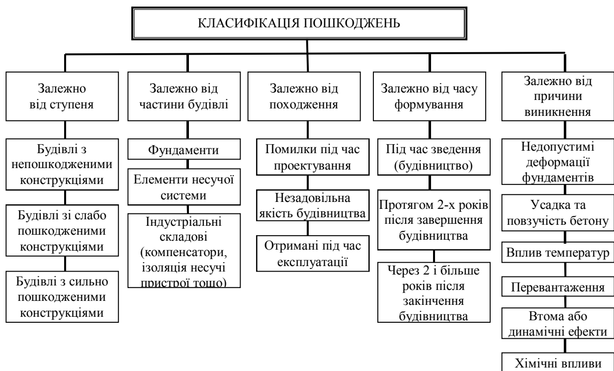
Рис. 2. Схема класифікації пошкоджень

можливість подальшої експлуатації будівлі загалом. Так, Державні будівельні норми України [1] зобов'язують під час проектування враховувати, крім величини зовнішнього навантаження, вплив температури; повзучість та усадку бетону; тривалість дії навантаження. Крім визначення граничного зовнішнього навантаження, яке може витримати конструкція до руйнування (несуча здатність), обмежується також ширина розкриття тріщин та їх переміщення (розрахунки за другою групою граничних станів). Аналогічно сформульовано норми та правила в інших європейських країнах. Так технічним комітетом DCC-104 РІЕМ (Міжнародної спілки експертів та лабораторій з випробування будівельних матеріалів, систем і конструкцій), починаючи з 1991 р. навів класифікацію пошкоджень в бетонних конструкціях [2] за три роки. Загалом можна зробити висновок, що більша частина пошкоджень бетонних конструкцій, які виникають в процесі експлуатації, виникають через помилки в процесі проектування (стадія проектування), неякісних технологій зведення та низької якості будівельних матеріалів (стадія будівництва), а також перевантаження конструкцій навантаженнями, вищими за проектні (стадія експлуатації). Класифікацію пошкоджень залізобетонних конструкцій наведено на рис. 2.