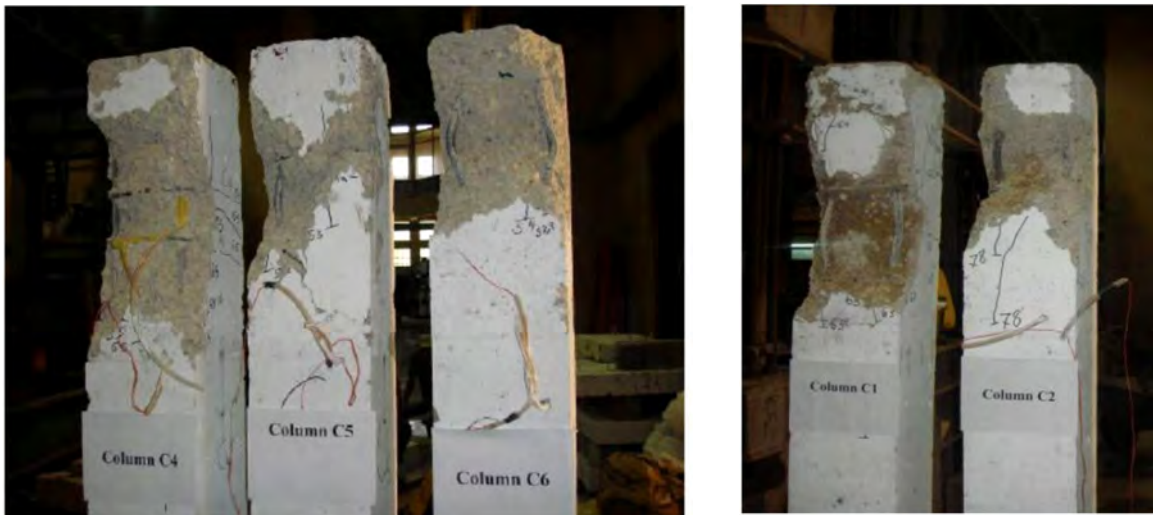
Рис. 4. Характерні пошкодження колон, навантажених осьювою силою (Rabi M.)

Під час обстеження будівлі та окремих її конструкцій виникають питання, на які можна відповісти, керуючись цією методикою: