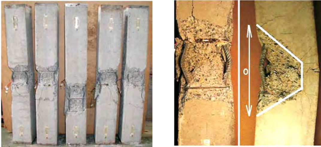
Рис. 3. Характерні пошкодження колон, навантажених осьювою силою (J. Němeček)