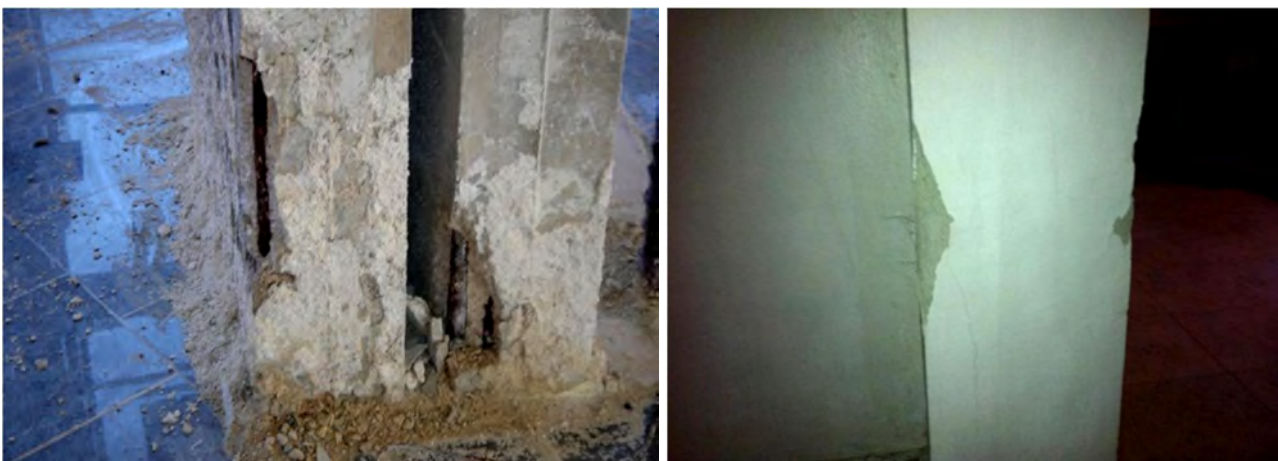
Рис. 1. Приклади типів пошкодження стиснених елементів

Однак під час експлуатації стиснені залізобетонні конструкції, як і усі інші, зазнають зносу. Найчастіше за сумісної дії стискної сили (прикладеної з розрахунковим або випадковим ексцентриситетом) та навколишнього (часто – агресивного середовища) зменшується поперечний переріз через руйнування частини бетонного масиву. На рис. 1 показано приклади пошкоджених стиснених елементів, часткове руйнування яких виникло в процесі експлуатації. Причиною пошкодження є результат сумісної дії різних факторів, а саме: довготривалого використання будівлі або споруди; постійної дії стискного, в цьому випадку навантаження; динамічного навантаження; агресивного впливу навколишнього середовища. Проблемою є визначення залишкової несучої здатності таких пошкоджених залізобетонних конструкцій, тобто визначення можливості подальшої експлуатації конструкцій.