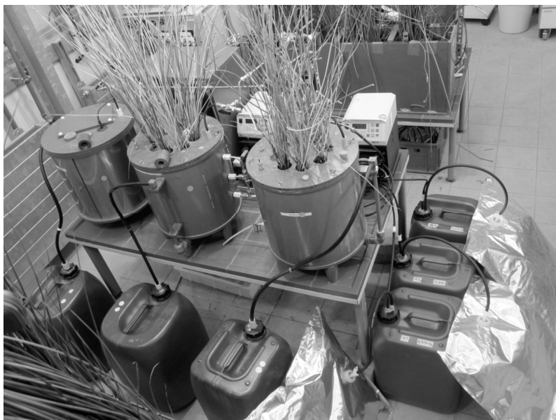
Рис. 1. Модельна установка для дослідження процесів усунення азоту в біоінженерних ставках

Матеріали та методи досліджень. Експериментальні дослідження проводили у модельних (рис. 1) та пілотних установках біоінженерних ставків в контрольованих кліматичних умовах, що були створені у Фітотехнікумі ( Phytotechnicum ) Центру екологічних досліджень імені Гельмгольца (Лейпциг, Німеччина). На основі одержаних результатів було визначено оптимальні технологічні рішення для розроблення системи очищення господарсько-побутових стічних вод малих населених пунктів. Як основу для досліджень обрано саме біоінженерні ставки з горизонтальним підповерхневим потоком, бо вони володіють рядом переваг над двома іншими типами БС, а саме: 1) не вимагають затрати енергоресурсів на процес очищення; 2) обмежують можливий контакт людини чи тварини зі стічними водами під час очищення; 3) не викликають появи комарів; 4) кардинально знижують можливість появи неприємних запахів.