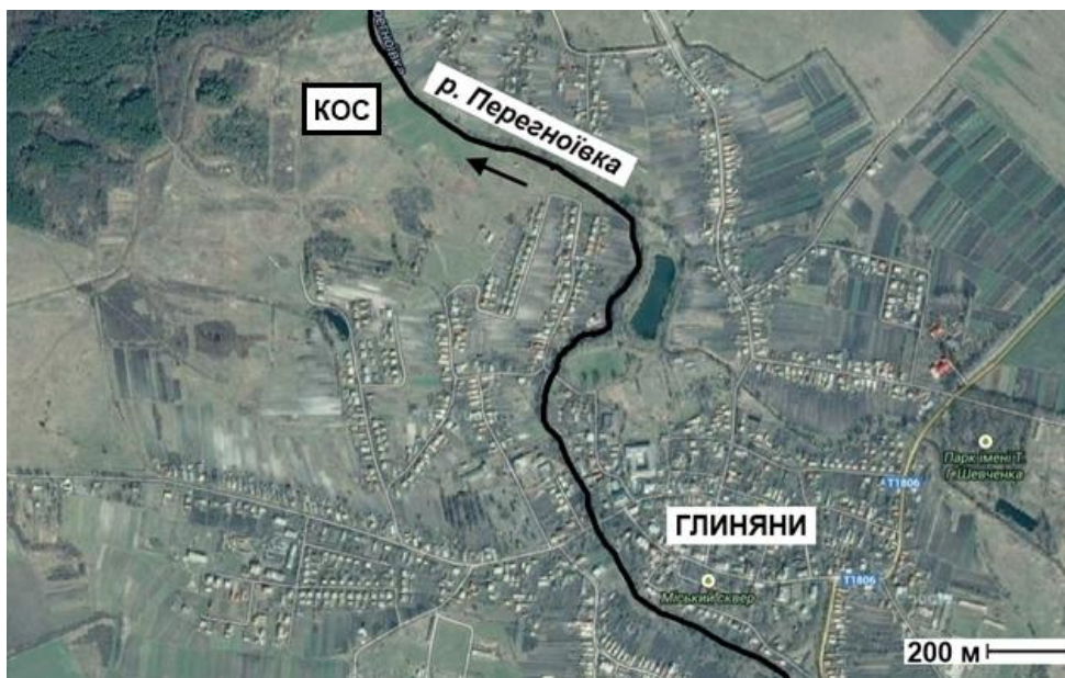
Рис. 2. Запропоноване місце розташування каналізаційних очисних споруд (КОС)

Рельєф місцевості, де розташовані Глиняни, рівнинний, із загальним нахилом на північ, тому міські каналізаційні очисні споруди (КОС) пропонується розташувати на незабудованих територіях на північному-заході від міста, неподалік від річки Перегноївка (рис. 2). Для спорудження КОС потужністю 100 \text{ м}^3/\text{добу} необхідна площа розміром приблизно 4000 \text{ м}^2 . Особливість технології в тому, що за необхідності можливо збільшити потужність системи, споруджуючи додаткові модулі біоінженерних ставків.