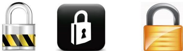
Рис. 2. Різновиди піктограм, які можуть використовуватися для введення жертви в оману

Під час такої атаки активно використовують логотипи захищених веб-сторінок, такі як піктограми замків золотистого або зеленого кольору, залежно від того, який браузер використовує жертва. Такі піктограми можна створити власноруч (рис. 2).