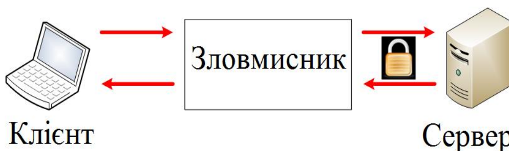
Рис. 1. Схема атаки “зловмисник посередині”, також відома як MitM (Man-in-the-Middle)

У цьому випадку найпоширенішим типом атак є атака “зловмисник посередині”, також відома як MitM (Man-in-the-Middle). Передбачається участь трьох сторін: сервера, клієнта і зловмисника між ними. У цій ситуації зловмисник може перехоплювати всі повідомлення, які слідує в обох напрямках, і модифікувати їх. Зловмисник представляється сервером для клієнта і клієнтом для сервера (рис. 1).