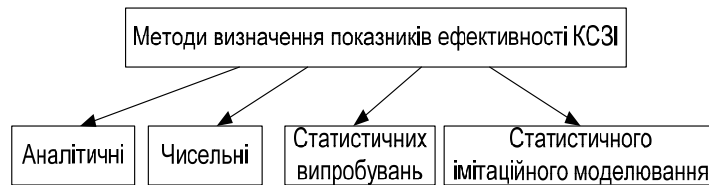
Рис. 1. Класифікація методів

Аналітичні методи ґрунтуються на безпосередньому інтегруванні за такою формулою: