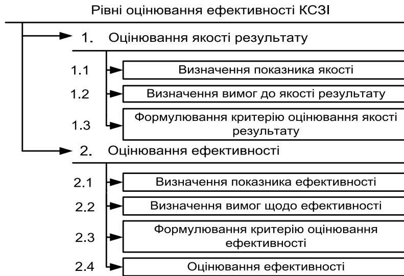
Рис. 2. Структура оцінювання ефективності КСЗІ

На рис. 2 подано рівні оцінювання ефективності КСЗІ