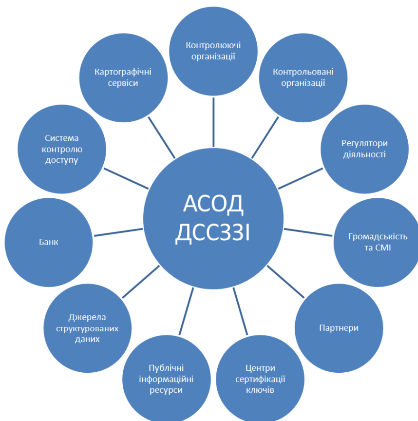
Рис. 1. Об'єкти зовнішнього інформаційного середовища АСОД ДСС331

Зовнішнє інформаційне середовище АСОД (рис. 1) включає ресурси з різним ступенем довіри до інформації, тому разом з даними зберігається рівень їх достовірності, який використовується у процесах прийняття рішень.