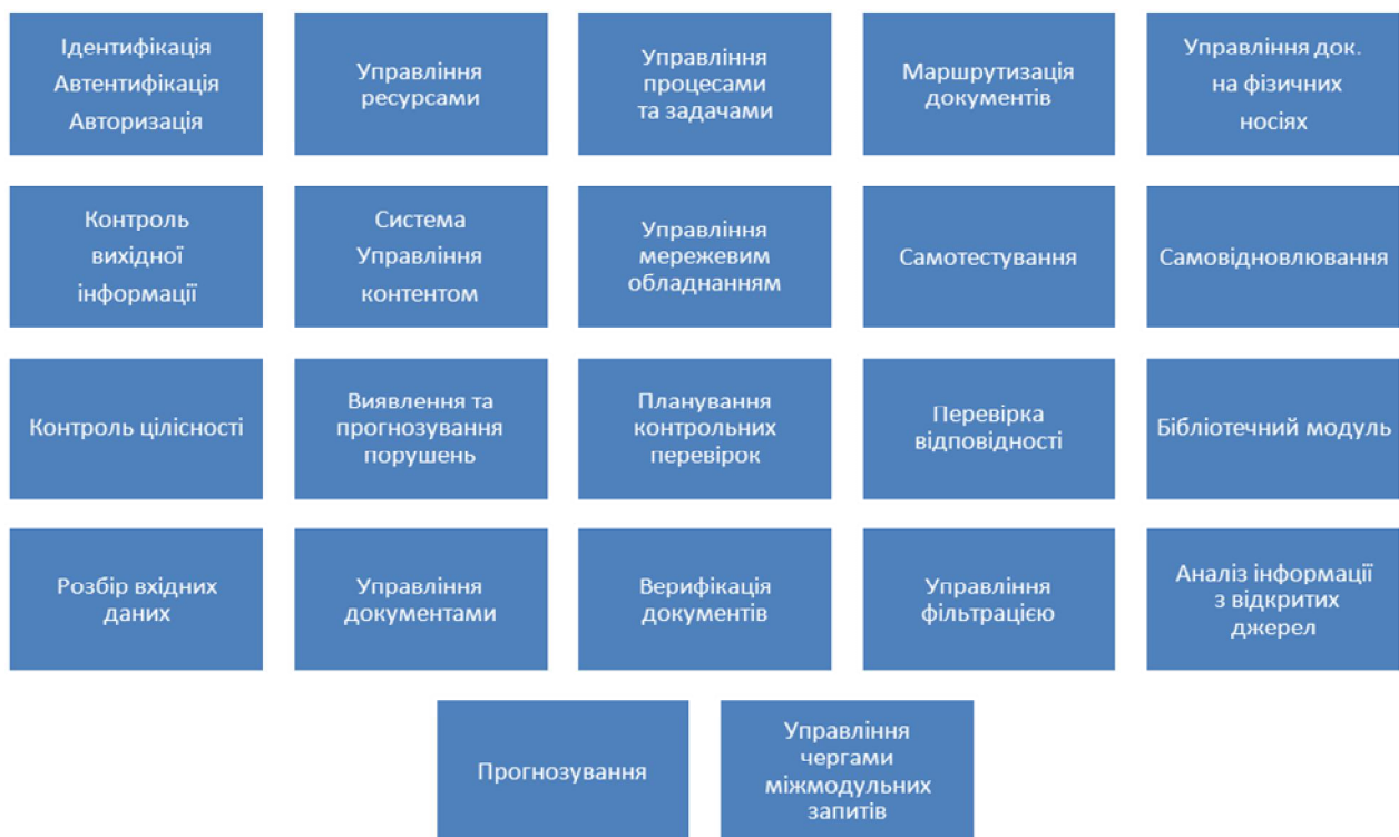
Рис. 3. Структура блока прийняття рішень АСОД ДСС331

Модуль авторизації призначений для надання і зняття прав за подією, наприклад, створення документа за шаблоном, для заповнення якого потрібно ознайомитись з ІЗОД, вирішення конфліктів прав/ролей для випадку, коли один користувач має багато ролей, реалізації процедур делегування повноважень.