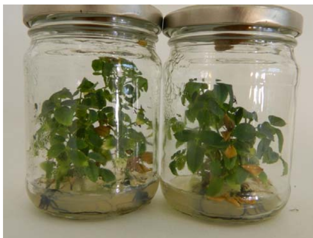
Рис. 1. Сформовані рослини-регенеранти троянди ефіроолійної

Встановлено, що для адаптації регенерантів використання двокомпонентних субстратів більш ефективно порівняно з однокомпонентними субстратами (рис. 3).