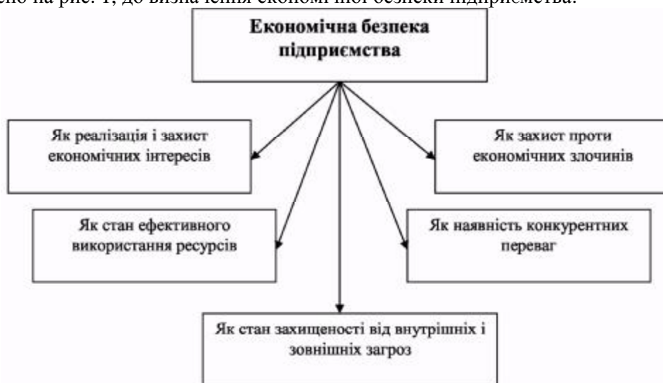
Рис. 1. Підходи до визначення поняття «економічна безпека підприємства» [7]

Під системою економічної безпеки підприємства розуміють комплекс організаційно-управлінських, технологічних, технічних, профілактичних і маркетингових заходів, спрямованих на кількісну й якісну реалізацію захисту інтересів підприємства від зовнішніх і внутрішніх загроз [6]. У цілому можна виділити декілька різних підходів [7], як це зазначено на рис. 1, до визначення економічної безпеки підприємства: