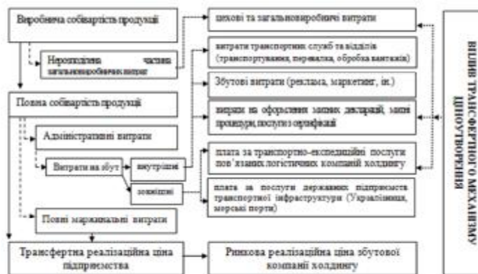
Рис.3 Модель впливу механізму трансфертного ціноутворення на процес формування логістичних витрат у структурі повної собівартості продукції виробничого підприємства у складі вертикально-інтегрованого холдингу

Модель демонструє, що трансфертне ціноутворення впливає як і на формування елементів виробничої собівартості продукції (наприклад, трансфертні ціни на сировинні та допоміжні ресурси, вироблені та встановлені пов'язаними підприємствами та компаніями), так і на вартість логістичних послуг, що надають пов'язані транспортні та логістичні підрозділи корпорації теж за внутрішньо корпоративними тарифами. Згідно даного висновку, збутові організації транснаціональних компаній мають можливість встановлювати адекватний рівень ринкової ціни на готову продукцію з урахуванням вартості логістичних послуг, що надаються пов'язаними логістичними компаніями, що врешті, по-перше, зумовлює зростання акумульованої суми прибутку у відповідних центрах доходів та прибутку холдингу, та, по-друге, сприяє процесу оптимізації логістичних схем управління.[11]