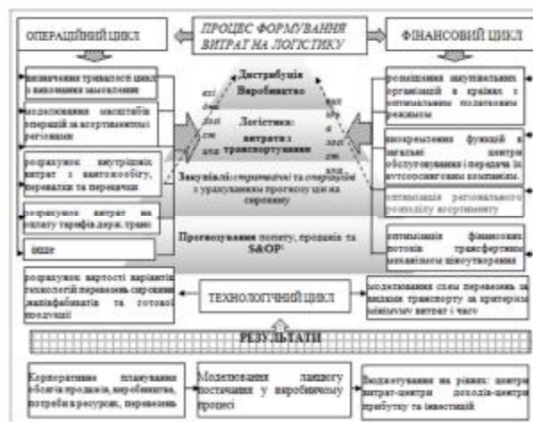
Рис.2. Модель взаємодії процесів планування та джерел формування логістичних витрат промислового вертикально-інтегрованого холдингу