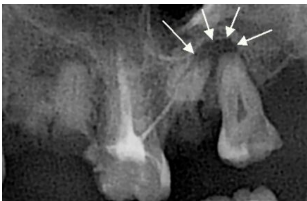
Мал. 1. Інтраоральні рентгенограми з періоститом верхньої щелепи.

Як видно з таблиці 2, у солдатів, при періоститі, в 1,4 рази рідше, ніж у офіцерів, виявлялася різноманітна симптоматика захворювання: 47 (41,6%) випадків проти 66 (58,4 %). Біль в причинному зубі, як один з основних сигналів хвороби достовірно частіше, в 5,3 рази, пред'являли офіцери, ніж пацієнти з строкового складу: 16 (80,0±10,8 %) випадків проти 3 (15,0±7,9 %), відповідно (p<0,05). В обох групах випадків скарг на біль при перкусії причинного зуба було більше, ніж випадків скарг на постійний характер болю, однак у офіцерів достовірно частіше, у 2,8 рази, ніж у пересічних: 20 (100±10,9 %) випадків проти 7 (35,0±10,4 %), відповідно (p<0,05). Рухливість причинного зуба була відзначена у 7 (35,0±10,4 %) і 5 (25,0±9,6 %) випадках, відповідно. Припухлість обличчя у пацієнтів різних груп військовослужбовців виявлена з однаковою частотою – у 20 (100±21,2 %), а ось наявності норич на слизовій ясені у 4 рази частіше виявлено у військовослужбовців строкової служби, ніж у офіцерів: 12 (60,0±10,9 %) випадків, проти 3 (15,0±7,9 %), відповідно (p<0,05), що може бути наслідком більш млявого перебігу гнійно-запального процесу в кістці.