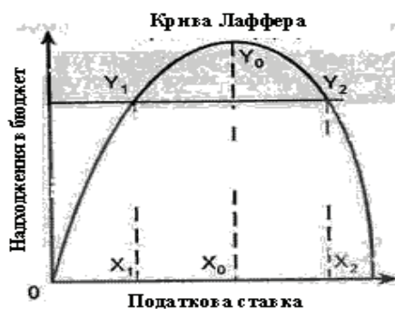
Рис. 2. Крива Лаффера

Також беремо до уваги, що досліджуючи зв'язок між розміром ставки податків і надходженням податкових засобів у державний бюджет, американський економіст Артур Лаффер показав, що не завжди підвищення ставки податку веде до зростання податкових доходів держави. Якщо податкова ставка перевищує якусь об'єктивну межу, то податкові надходження почнуть зменшуватися. А. Лаффер довів, що те саме за розміром надходження в державний бюджет може бути забезпечене і при високій, і при низькій податковій ставці. Це положення можна проаналізувати графічно (рис. 2):