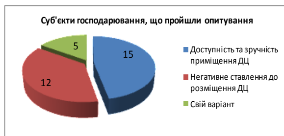
Рис. 2. Доступність та зручність приміщення Дозвільного центру

Доступним та зручним приміщення дозвільного центру вважають 15 опитуваних, що склало 46,8 %, негативно висловилися 12 опитуваних, або 37,6 %. Свій варіант запропонували 5 осіб, або 15,6 % опитуваних, а саме: виділити більш просторе приміщення, створити умови для прийому відвідувачів, організації по роботі з прийому відвідувачів (черги) та ін. (рис. 2).